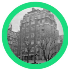
Sur les chemins d'Olympe 2023

Dialogues en photographie Adhérer Actualités